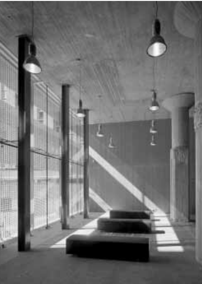
Senaatti-kiinteistöjen pääkonttori, Arkkitehtitoimisto Heikkinen-Komonen.