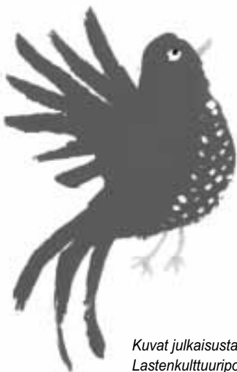
Kuvat julkaisusta Lastenkulttuuripoliittinen ohjelma, kuvitus Emmi Kyytönen

Lastenkulttuuri osuuteen painetussa mediassa tulee tekijöiden vastuuta, lasten ja nuorten valis-